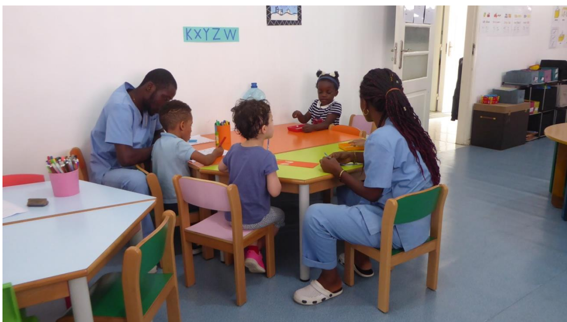
Atelier de moyenne section avec les ATSEM.