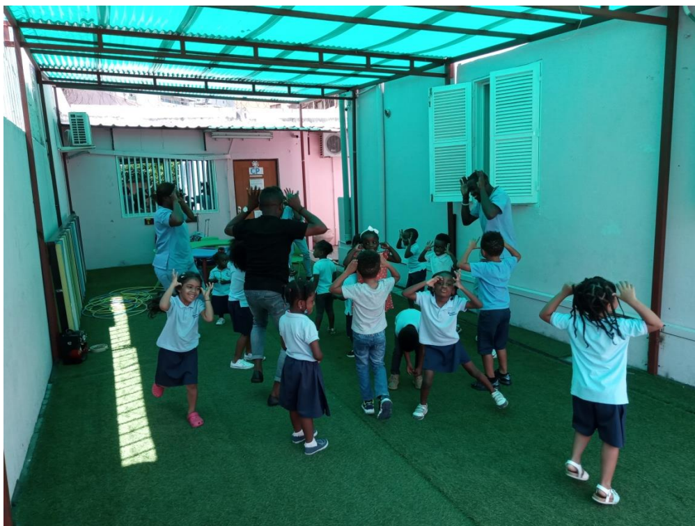
Les élèves de moyenne section dans la cour