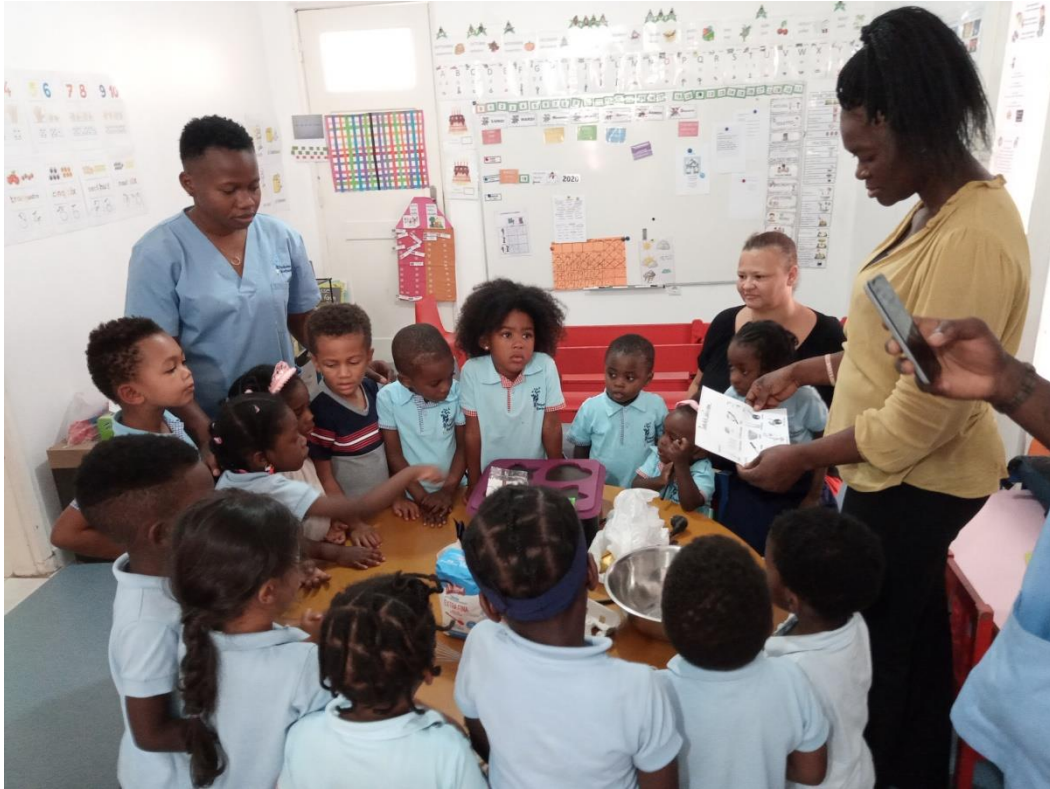
Toute petite section, petite section et moyenne section se préparant à faire des crêpes.