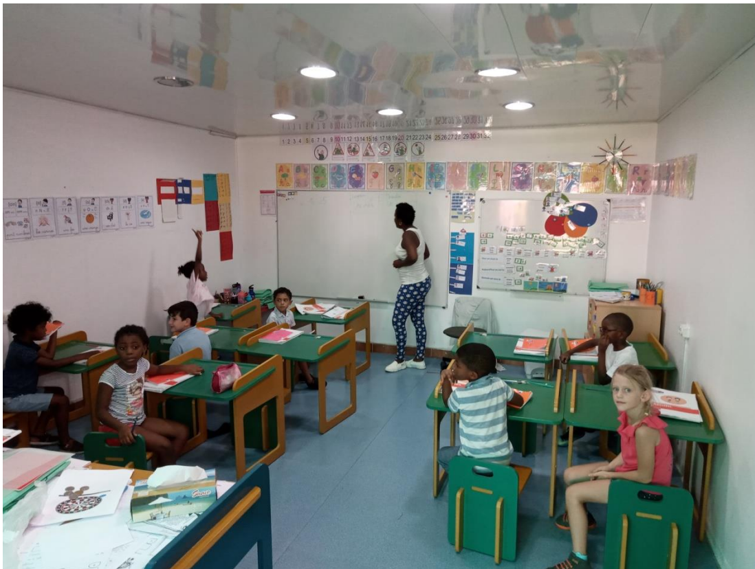
Le cours préparatoire